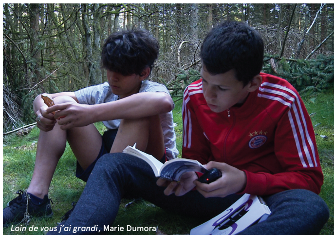
Loïn de vous j'ai grandi, Marie Dumora

Subbar, Sabra Brognon-Rollin, 2015, 7' Somebody Is Carrying A Cross Down Brognon-Rollin, 2019, 6' The Agreement Brognon-Rollin, 2015, 10' Barbed Hula Sigalit Landau, 2001, 2'